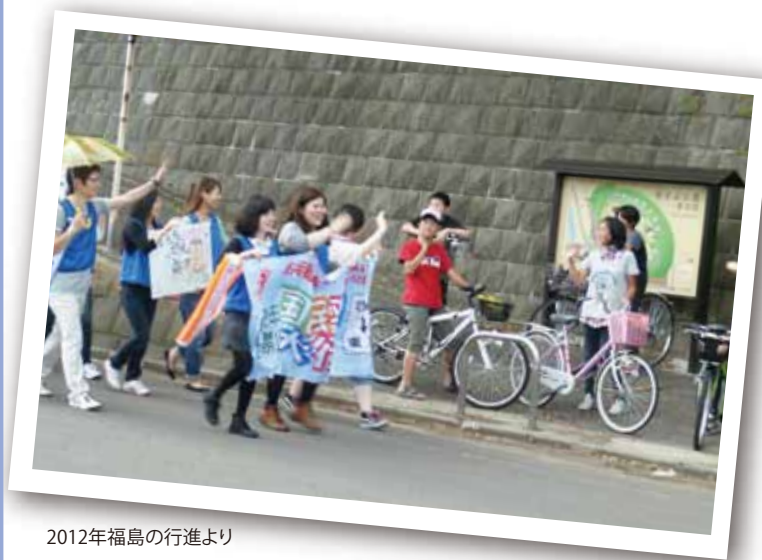
2012年福島の行進より

今日では全都道府県の8割を越える自治体を通り、毎年約10万人が参加しています。「核兵器のない平和で公正な世界」を願う人なら、誰もが参加できます。