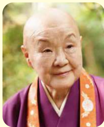
瀬戸内 寂聴 作家