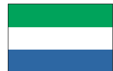
シエラレオネ共和国