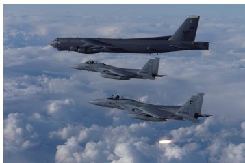
核搭載可能なB52H戦略爆撃機と自衛隊F-15戦闘機との日米共同訓練

石破政権もこの路線をそのまま推進しています。石破首相は国是である非核三原則(核兵器を持たず、作らず、持ち込ませず)を見直し、「核共有」を柱とする「アジア版NATO」創設を主張しています。2025年度予算で過去最高の8兆7千億円もの防衛費(軍事費)を計上しました。