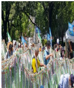
昨年の原爆ドーム前式典